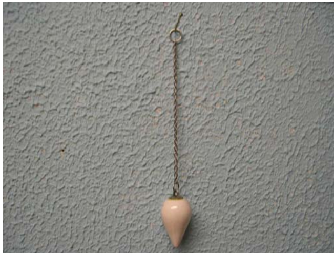
Le Pendule de SIKI

Pour recevoir des messages du Cosmique, il faut posséder un ou des moyens quelconques.