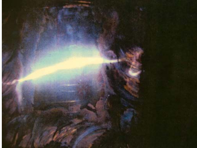
Photo d'une Pile Cosmique démontrant l'Énergie Cosmique contenue. ( Photo de la couverture)

SIKI de son côté expérimentait principalement la Projection Astrale tout en poursuivant ses études du Cosmique.