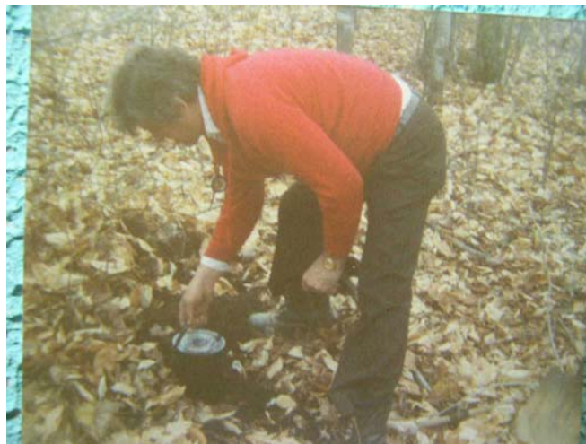
SIKI enfouissant la pile centrale no. 7 (1981)