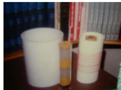
Pile 1 en construction