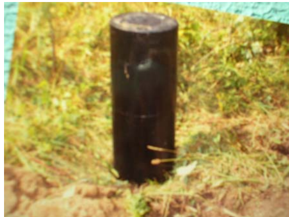
Photo de la pile centrale avant de l'enterrer